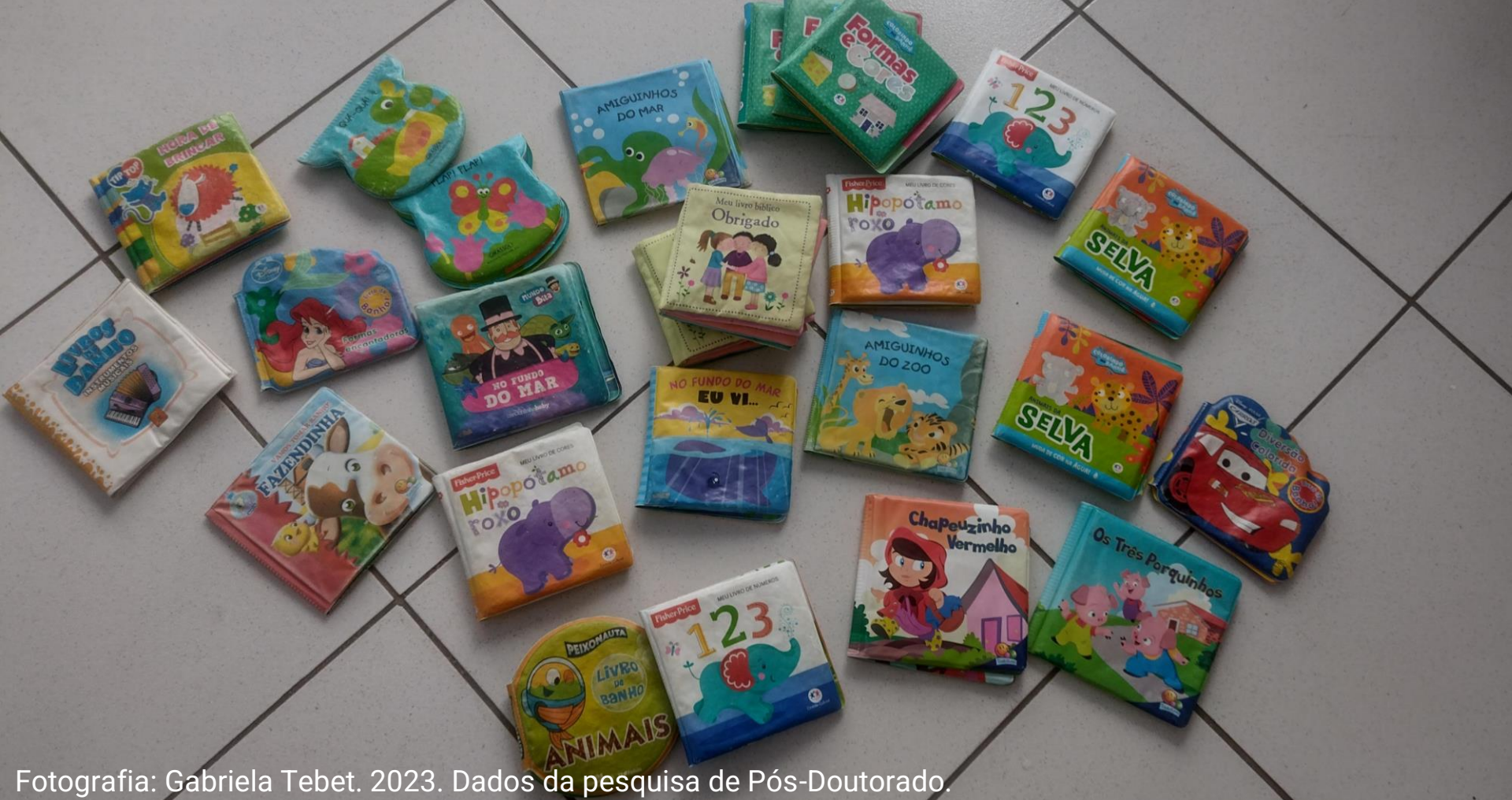
2023. Dados da pesquisa de Pós-Doutorado.